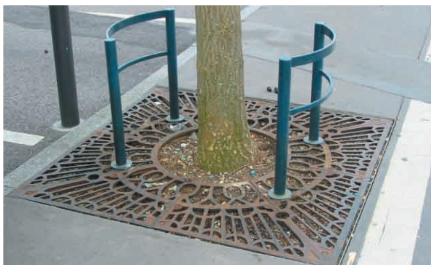
Grille et protections à Nancy