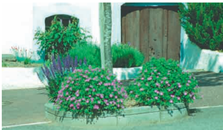
Plantation de vivaces à Villey-le-Sec