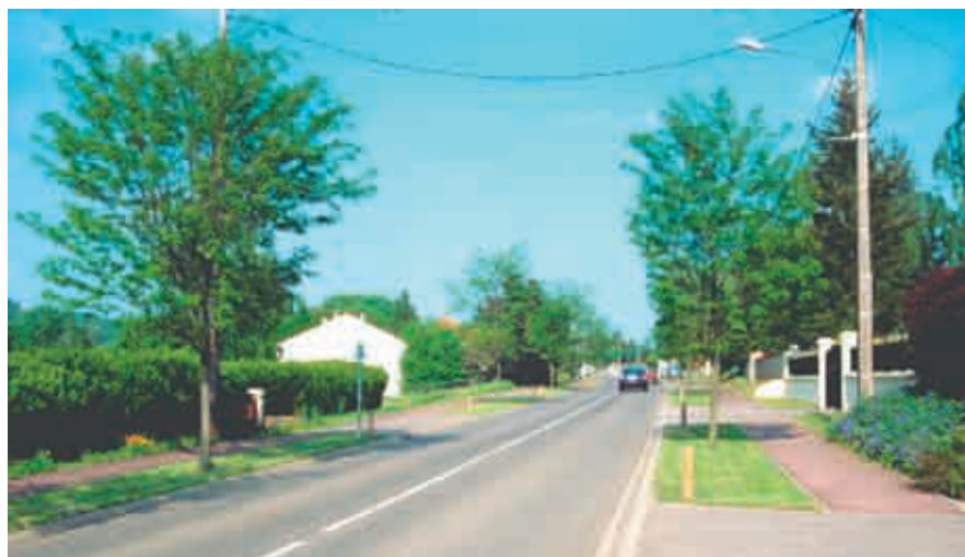
Bornes bois et herbe à Faulx