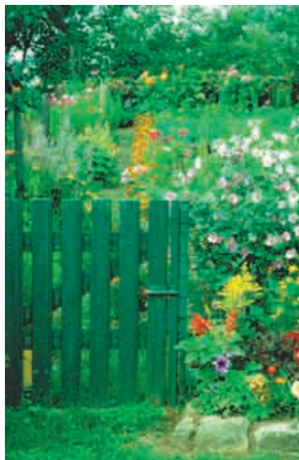
Haie mélangée à Vaudémont