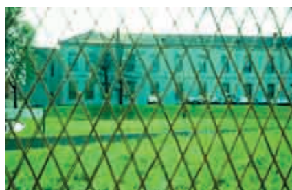
Haie monospécifique (saules tressés) à Nancy