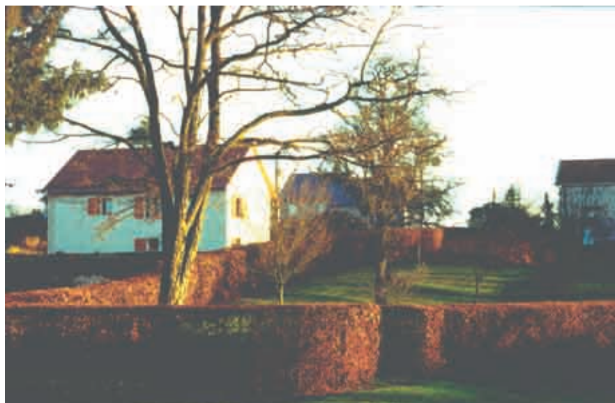
Haie monospécifique (feuillage marscescent des charmilles) à Réméréville

Un binage régulier (mensuel) offre de meilleurs résultats. Pour limiter le travail, on peut couvrir le sol d'un mulch type terreau pour faciliter le binage ou un mulch type feutre perméable.