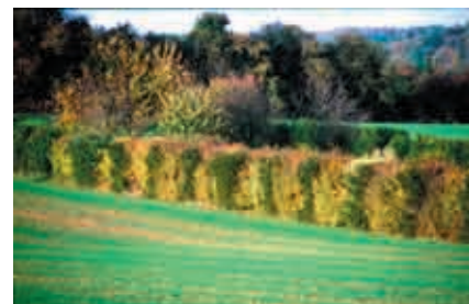
Haie mélangée à Repaix