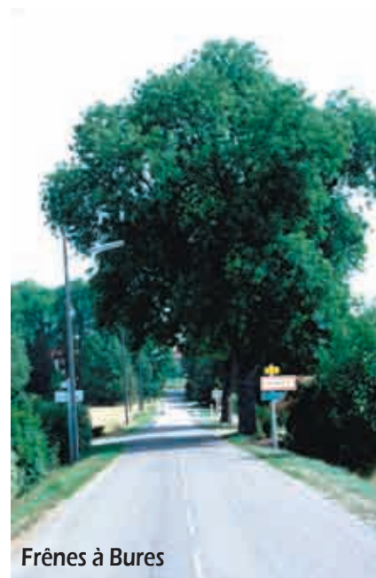
Frênes à Bures