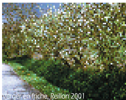
verger en friche, Reillon 2001