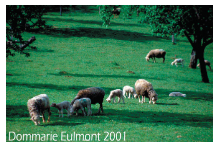
Dommarie Eulmont 2001